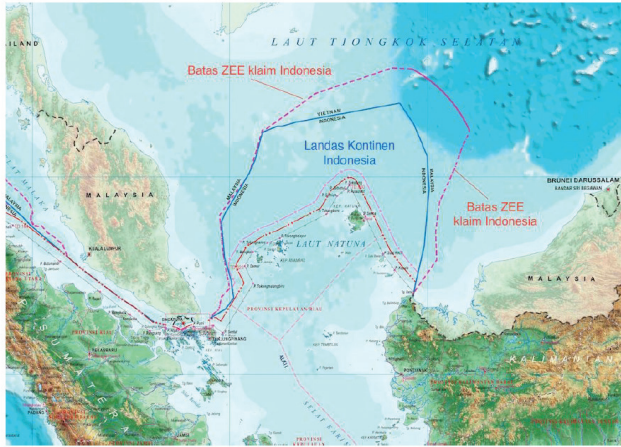
Gambar 9.4. Wilayah Perairan Natuna yang Diklaim oleh Tiongkok

Tahun 2009, Tiongkok melanggar sembilan titik ditarik dari Pulau Spartly ditengah Laut Cina Selatan yang kemudian diklaim sebagai wilayah Zona Ekonomi Eksklusifnya. RRT menganggap bahwa garis putus-putus yang diklaimnya sebagai pembaharuan peta 1947. Pada 1947, Tiongkok mulai menuntut wilayah Laut Cina Selatan dan perairan Natuna ketika Tiongkok mengeluarkan peta pada tahun 1947. Masa pemerintahan nasionalis Chiang Kai-Sek menetapkan Sembilan garis putus-putus yang meliputi hampir seluruh Laut Cina Selatan. Kemudian, pada masa pemerintahan Zhou En-Lai pada tahun 1951, kembali menegaskan tuntutananya pada wilayah perairan tersebut. Presiden Republik Indonesia Susilo Bambang Yudhoyono pada waktu itu kemudian memprotes langkah Tiongkok tersebut melalui Komisi Landas Kontinen PBB. Pada era Presiden Joko Widodo kembali menegaskan bahwa sembilan titik yang diklaim Tiongkok tidak memiliki dasar hukum internasional apa pun karena sembilan garis putus-putus tersebut akan memotong batas landas kontinen yang disepa-