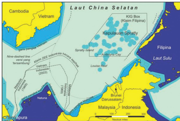
Gambar 9.3. Isu Perbatasan Indonesia-Vietnam di Wilayah Laut Cina Selatan

negara. Antara 2010-2016, negosiasi ZEE Indonesia dan Vietnam telah diadakan dalam delapan putaran. Negosiasi akhir, negosiasi teknis ke-8 tentang pembatasan ZEE Indonesia-Vietnam telah diadakan di Bali, 22-24 Maret 2016. Penyelesaian teknis berikutnya direncanakan akan berlangsung di Vietnam pada bulan April atau Mei 2016 (Fauzan et al., 2019).