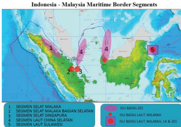
Gambar 9.2. Perbatasan Maritim Indonesia-Malaysia yang sedang dinegosiasikan

Utusan khusus kedua negara telah mengadakan pertemuan kedua antara utusan khusus di Bali pada 11-12 Februari 2016 (Fauzan et al., 2019).