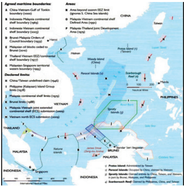
Gambar 9.5. Teritorial Laut Cina Selatan yang Diklaim Tiongkok

kati dengan Malaysia dan Vietnam, dan memotong batas ZEE Indonesia.