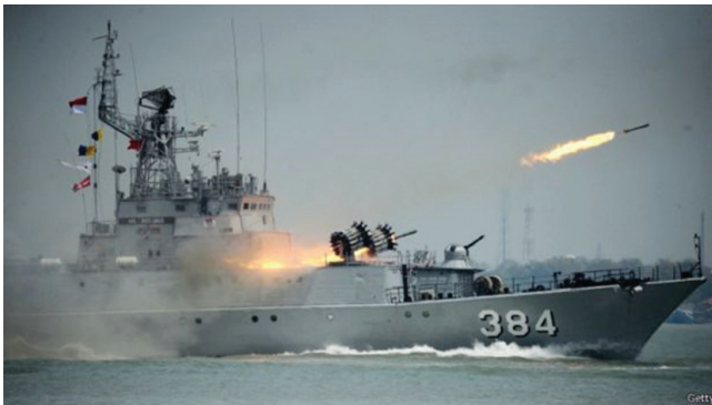
Gambar 9.1. Kapal Milik TNI AL yang Sedang Melakukan Latihan

Kapal perang TNI AL, KRI Oswald Siahaan-354 merupakan kapal perang yang seukuran dengan kapal perang penjaga pantai milik Tiongkok menangkap kapal Gui Bei Yu 27088 dengan delapan anak buah kapal asal Tiongkok pada tanggal 29 Mei 2020. Kapal tersebut mencuri ikan di perairan Natuna. Di kapal Gui Bei Yu, ditemukan peta yang menggambarkan area penangkapan ikan yang diterbitkan langsung oleh pemerintah Tiongkok. Dalam peta tersebut, wilayah ZEE Indonesia termasuk dalam area penangkapan ikan Tiongkok. Menurut Tiongkok, hal ini sejalan dengan wilayah penangkapan ikan tradisional dari pelaut-pelaut Tiongkok (Muhibat, 2016).