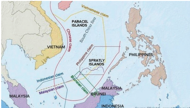
Gambar 4.1. Kawasan Laut Cina Selatan yang penuh Sengketa

Pendekatan soft power juga diterapkan dalam isu Laut Cina Selatan. Pada tahun 2018, Tiongkok melakukan latihan militer bersama antara Tiongkok dan negara-negara ASEAN di Provinsi Guangdong, wilayah pesisir Laut Cina Selatan selama satu minggu. Pelatihan bersama ini diusulkan oleh Tiongkok dalam pertemuan dengan menteri se-ASEAN tahun 2015. Latihan ini merupakan suatu Confidence Building Measure (CBM) untuk menurunkan ketegangan di kawasan tersebut (Rosyidin, 2018).